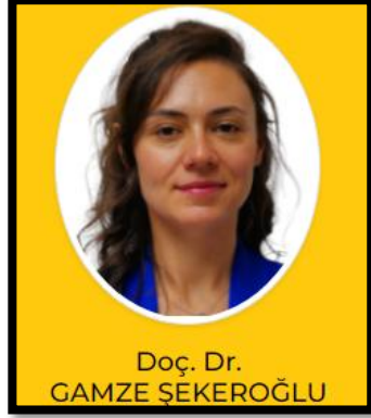
Bölüm Başkan Yardımcısı