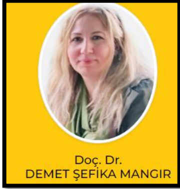
Bölüm Başkan Yardımcısı