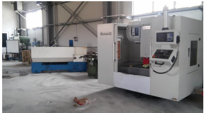
Şekil 2. Teknoloji Fakültesi Merkez Laboratuvar Görüntüleri