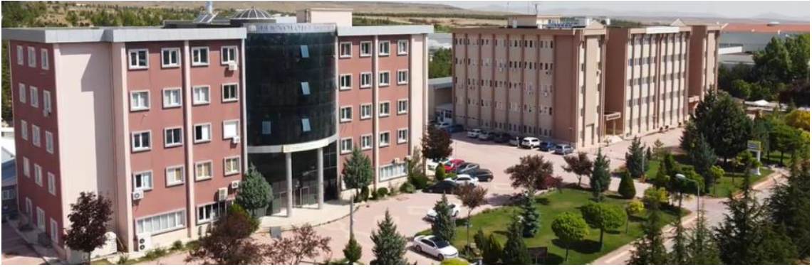
Şekil 1. Teknoloji Fakültesi A ve B Blok Görünümü

Selçuk Üniversitesi Teknoloji Fakültesi 13.11.2009 tarih ve 27405 sayılı Resmî Gazetede yayımlanan Bakanlar Kurulu kararı ile endüstrinin ihtiyaç duyduğu uygulama becerisi yüksek, mühendisler yetiştirmek üzere kurulmuş olan 21 Teknoloji Fakültesinden biridir. 2010-2011 öğretim yılında Bilgisayar Mühendisliği, Elektrik-Elektronik Mühendisliği, Makine Mühendisliği, Metalürji ve Malzeme Mühendisliği bölümleri açılmıştır. 2012-2013 öğretim yılında Bilgisayar Mühendisliği, Elektrik-Elektronik Mühendisliği ve Makine Mühendisliği bölümlerine öğrenci alarak lisans öğretimi başlamıştır. 2017 yılında fakültemize Biyomedikal Mühendisliği ve Mekatronik Mühendisliği bölümleri kurulmuştur. 2020 yılında Mekatronik Mühendisliği bölümüne öğrenci alarak lisans öğretimi başlamıştır.